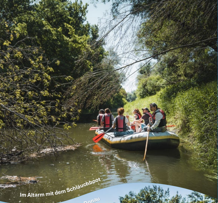
Im Altarm mit dem Schlauchboot