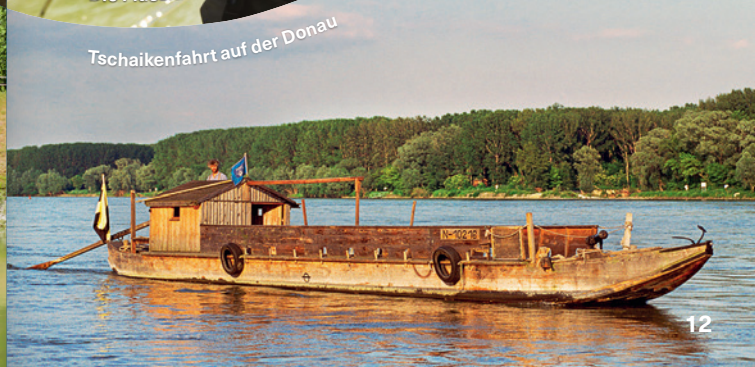
Tschaikenfahrt auf der Donau