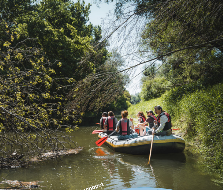
Im Altarm mit dem Schlauchboot