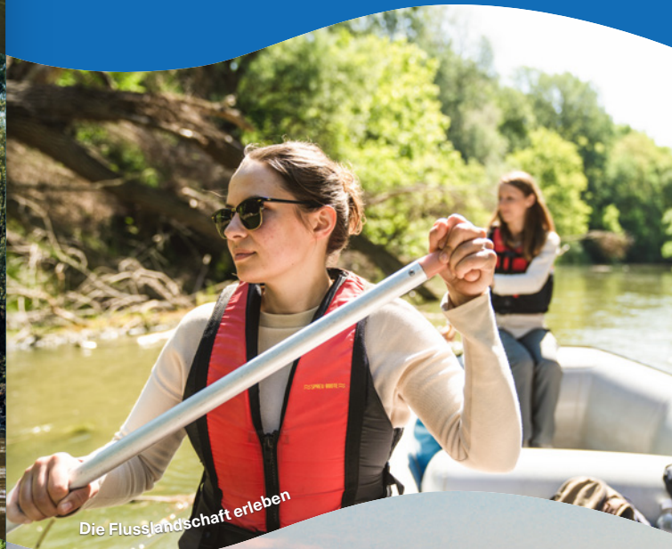
Die Flusslandschaft erleben

Genauere Informationen zu den Programmen inkl. Zielgruppe, Altersbeschränkungen etc. finden Sie stets aktuell auf www.donauauen.at .