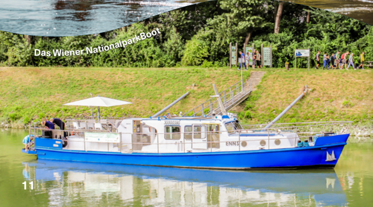
Das Wiener NationalparkBoot