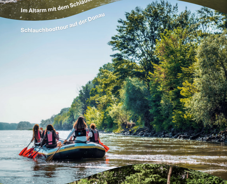
Schlauchboottour auf der Donau